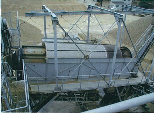
■ 砂利・碎石選別用