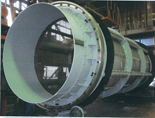
■ 製鐵所副産物選別用

トロンメルは、円回転のため無理なく、あらゆる篩分けに利用できます。よって、さまざまな分野でトロンメルは使用されています。