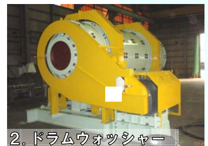
2. ドラムウォッシャー