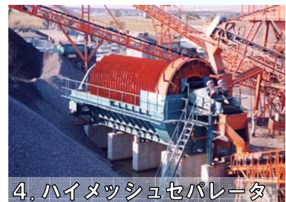
4. ハイメッシュセパレータ