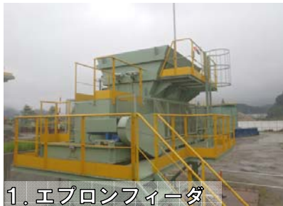
1. エプロンフィーダ