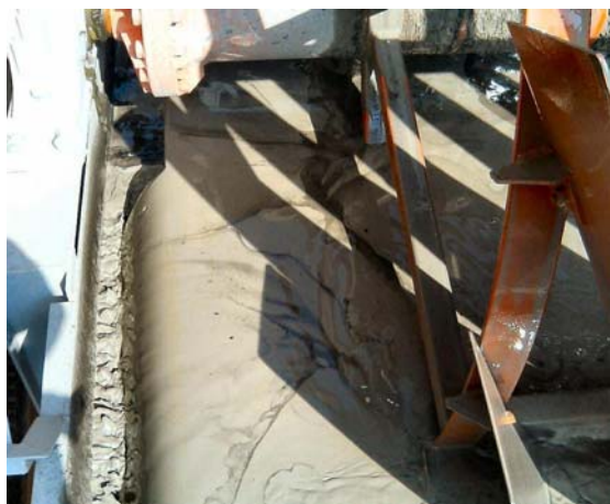
カーボン除去の例